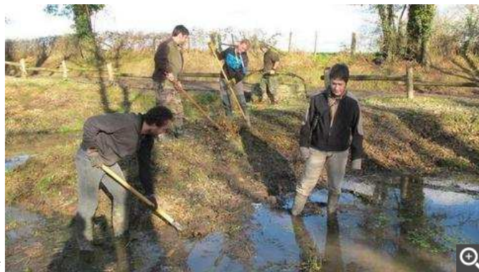
Toute une journée à restaurer quatre mares. Les étudiants de Melle ont relevé les manches !